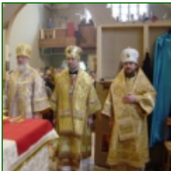
Consecration of the Holy Trinity Church in Brussels