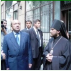
Russian Foreign Minister visited Hungarian Orthodox Cathedral