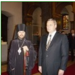
Russian Prime Minister M.Kasyanov visited Hungarian Orthodox Cathedral