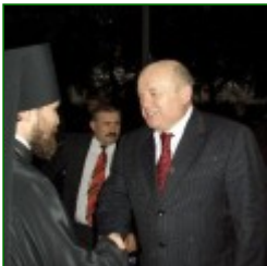
Russian Prime Minister M.Fradkov visited Hungarian Orthodox Cathedral