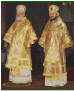
Metropolitan Kirill visited Hungary

visited Russian Orthodox Cathedral in Vienna