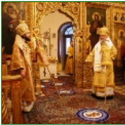
Metropolitan Kirill visited Austria