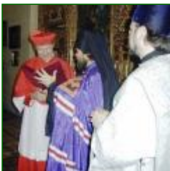
Archbishop of Salzburg

sainteté, elles semblent intéressées par la pastorale de la charité, en faveur de laquelle elles investissent beaucoup d'argent et dépensent beaucoup d'énergie.