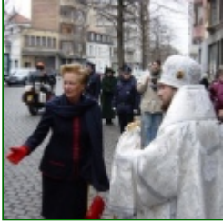
Queen Paola of the Belgians visited Church Representation in Brussels