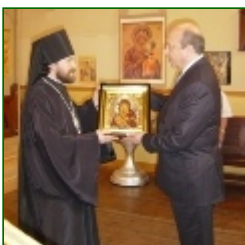
Russian Foreign Minister visited Church Representation

réaffirmée dans plusieurs documents du Concile Vatican II (SC 48.51.56; DV 21.26; AG 6.15; PO 18; PC 6). Des expressions comme Corpus Christi intellegitur etiam Scriptura Dei [5], Corpus Christi puto Evangelium [6], ou celles, peut-être moins connues, comme: «Se nourrir de la chair et du sang du Christ non seulement dans le mystère de l'autel, mais aussi dans la lecture des Écritures» [7], ou bien: «Le pain du Christ et sa chair sont la Parole de Dieu» [8], ces expressions, attestées et répétées de différentes manières par la grande tradition catholique, sont reprises aujourd'hui par la catéchèse. Et pourtant, il subsiste encore une sorte de timidité à affirmer qu'entre l'Écriture et l'Eucharistie il y a un rapport intrinsèque, une périchorèse . Trop souvent encore, la Parole n'est comprise que comme une simple introduction à la célébration du sacrement. On ne lui reconnaît pas la capacité de réaliser l'alliance: faire entrer le croyant dans une relation vivifiante avec Dieu. Dans une certaine mesure, l'idée persiste que c'est le sacrement qui donne la grâce, tandis que la Parole biblique donne un enseignement ou explique le sacrement.