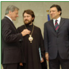
European Commission President J.M.Barroso and Austrian Chancellor W.Schussel Meet with Religious Leaders