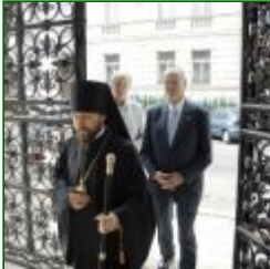
Austrian Parliament President visited Orthodox Cathedral in Vienna