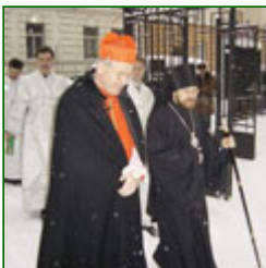
Cardinal Christoph Schönborn visited Russian Orthodox Cathedral in Vienna