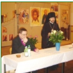
Archbishop of Finland visited Church Representation in Brussels