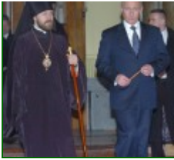
Russian President V. Putin visits Hungarian Orthodox Cathedral