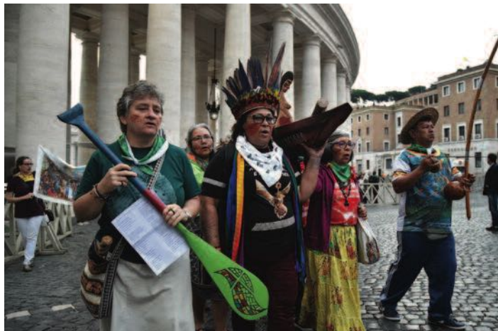
Autochtones et missionnaires à Rome pour le synode sur l'Amazonie.

Dans la récapitulation qu'il en fait à son terme, le 26 octobre, le pape François utilise à profusion un vocabulaire qui incite ses frères évêques à aller de l'avant avec confiance et ouverture, à faire preuve de créativité, à ne pas avoir peur, à porter au loin leur regard. Il répète, et le document final également, les mots « conversion » et « nouveaux chemins ». En pensant aux suites du Synode, il lance aux Pères synodaux et aux médias un appel insistant à s'intéresser avant tout aux diagnostics culturels, écologiques, sociaux et pastoraux précisés durant les échanges. Selon lui, c'est ce qui a eu le plus de poids et c'est là où le Synode s'est le mieux exprimé. Qu'est-ce à dire? Les diagnostics parlent de la situation des hommes et de leurs terres défigurées. Reprendre ces diagnostics, les faire connaître à la face du monde et inciter toutes les instances possibles à répondre aux