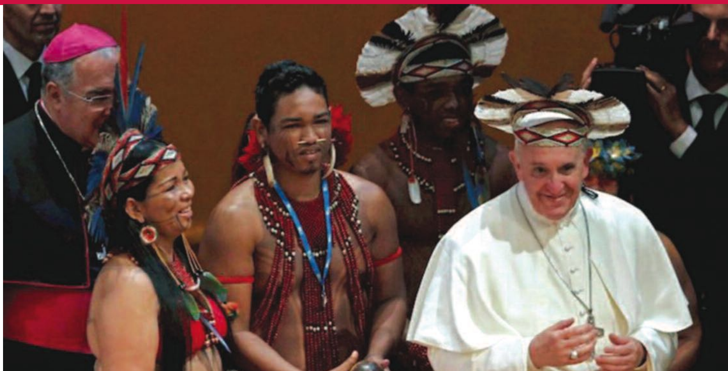
L'acculturation de l'évangile au centre du synode sur l'Amazonie.

passent vite à des mises en garde contre les possibles initiatives visant à réformer les structures. Quelle motivation, par exemple, guide le Cardinal Ouellet quand il fait coïncider la parution de son ouvrage sur le célibat sacerdotal avec la tenue du Synode ? Dans une entrevue diffusée par la chaîne catholique française KTO, il insiste sur l'identité du prêtre qui porte, inscrit dans sa personne, le sens même de l'Eucharistie. Seul son renoncement au monde manifesté par son célibat pourrait, selon lui, rendre compte authentiquement de la divinité du Christ. Il ne faudrait pas, ajoute-t-il, qu'« on tienne plus à l'inculturation qu'au prêtre ». N'y a-t-il pas ici un désir de perpétuer la sacralisation du prêtre, quitte à oublier combien cette identité s'est forgée dans un contexte civilisationnel particulier? Quitte à oublier aussi la réalité concrète des communautés amazoniennes privées d'Eucharistie? En contrepoids, d'autres voix plaident que les « diaconies de la foi » sont plus nécessaires que les « ministres du sacré ».